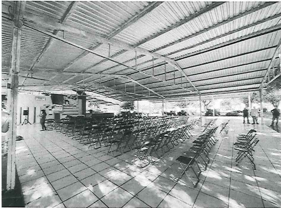
PLACA FOTOGRAFÍCA 2.