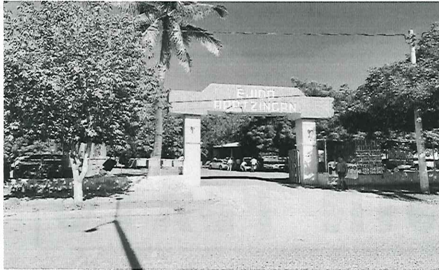
PLACA FOTOGRAFÍCA 1.

Organización "TIEMPO X MÉXICO A.C." Apatzingán, Michoacán. Domingo 04 de diciembre de 2022.