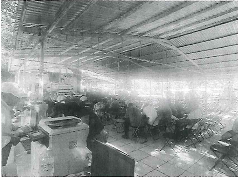
PLACA FOTOGRAFÍCA 4